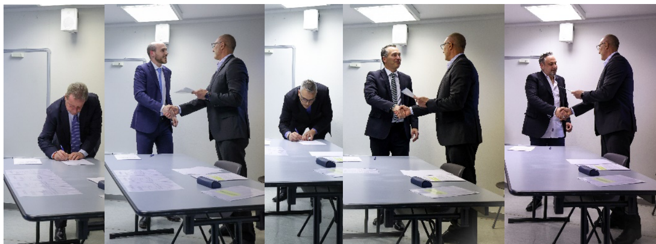
I Municipalisti sottoscrivono la dichiarazione di fedeltà alla Costituzione e alle Leggi davanti al sostituto Giudice di Pace, Davide Cavagna

L'attività del Municipio è iniziata ufficialmente dopo la cerimonia di insediamento che ha avuto luogo giovedì 18 aprile 2024 presso il Centro Comunale ed è stata celebrata dal sostituto Giudice di Pace, Davide Cavagna.