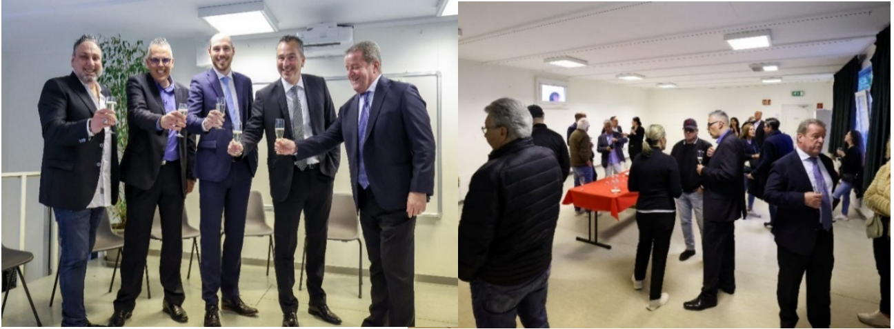
E' seguito poi l'aperitivo aperto alla popolazione che ha registrato un'ottima partecipazione.