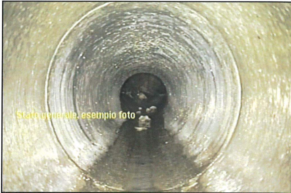
Tratta PZ 70 A – PZ 70 B (D = 300 mm): Stato generale

Analizzando i risultati ottenuti, non si è riscontrato uno stato di degrado tale da giustificare l'immediata sostituzione della canalizzazione.