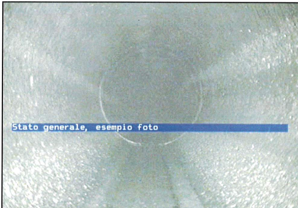
Tratta PZ 73 – PZ 73 A (D = 400 mm): Stato generale