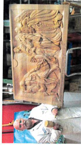
"Il trasporto di Cristo al sepolcro" 2009-2014 (altorilievo su legno di noce)