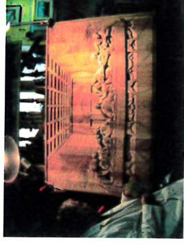
"Il Cenacolo" 1999-2004 altorilievo su legno di noce)

500 Opere esposte e in vendita a scopo benefico a sostegno del progetto per disabili adulti, corsi speciali per : utenti della Fonte di Neggio, utenti del Centro Diurno di Lugano, per gli allievi delle Scuole speciali di, Lugano, Pregassona, Breganzona