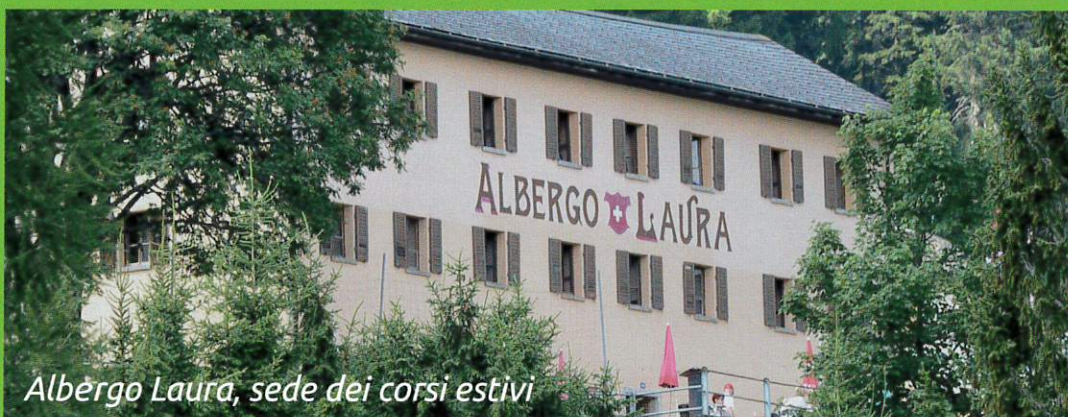
Albergo Laura, sede dei corsi estivi

Sono aperte le iscrizioni per allievi di scuola media ed elementare, pubblica e privata.